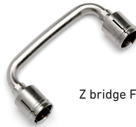
Z bridge F connector 45.3 mm